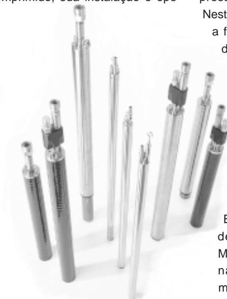
As bombas pneumáticas são fabricadas em vários tamanhos e diâmetros, com várias opções de materiais.

As bombas pneumáticas utilizam ar comprimido, sua instalação e ope-