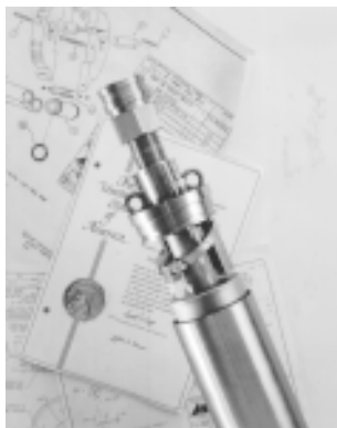
O mecanismo de válvulas de ar das bombas pneumáticas "sem controlador" permite a passagem de água, óleo e partículas sólidas sem o risco de falha.

líquidos para resfriamento. Algumas bombas pneumáticas de deslocamento de ar foram projetadas para ser acionadas automaticamente somente quando estão cheias e permanecem desligadas quando estiverem vazias ou em enchimento.